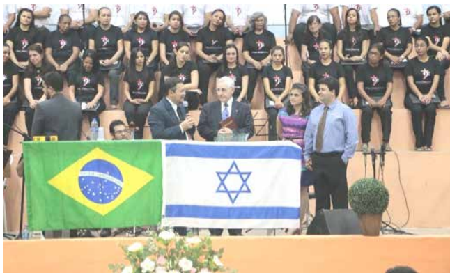
Despedida na IBF Cristo é Vida

Depois de nossa despedida no Brasil, fomos muito bem recebidos no Texas. Deus está cuidando de nós e suprindo cada necessidade de modo maravilhoso.