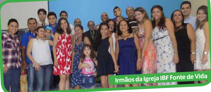
Irmãos da Igreja IBF Fonte de Vida