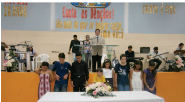
Primeiro Lugar – Competições da EBEC

“... são mais do que se podem contar” - Salmo 40:5