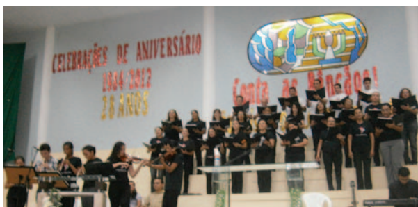
Coral Cristo é Vida