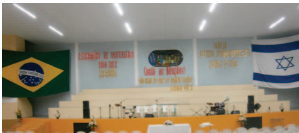
Celebrações de 28 anos