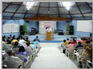
A presença de irmãos "jovens" foi satisfatória, em média 180 pessoas. No sábado promoveu-se um passeio para a Lagoa do Cauípi.