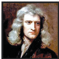
Sir Isaac Newton (1642-1727) Físico, matemático e astrônomo

- Este mecanismo, - respondeu Newton, - não é senão uma ínfima imitação de um sistema muito mais grandioso, cujas leis você conhece. Ora, eu não sou capaz de convencê-lo de que este mero brinquedo existe sem um projetista e fabricante; ainda assim, você professa crer que o maravilhoso original (do qual eu grosseiramente copiei e imitei um aspecto do projeto) veio a existir sem ter projetista e sem ter fabricante! Agora, diga-me, por qual tipo de raciocínio você chega a uma conclusão tão absurda?