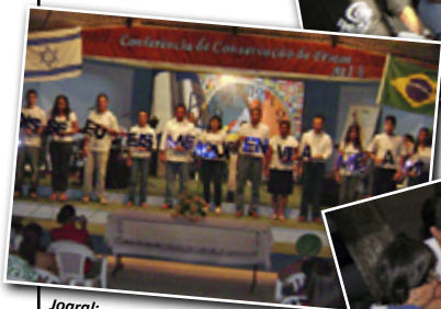
Jogral: Disse eu: eis-me aqui, envia-me a mim