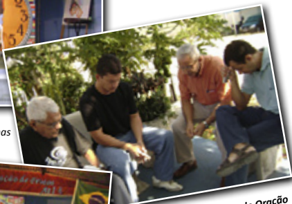
Tempo de Oração