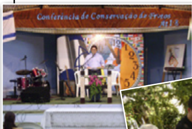
Mensagem Pastoral: Quebrando Malditos Paradigmas