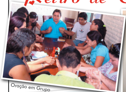
Oração em Grupo