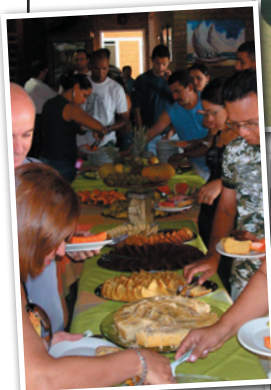
Café da Manhã no H. Don'Ana