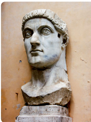
Estátua de Constantino, Imperador Romano

* Em 370 , principia-se o uso dos altares e velas. Pelo fim do século IV, o culto dos santos foi introduzido por Basílio de Cesaréia e Gregório Nazianzeno. Também apareceu pela primeira vez o uso do incenso e turíbulo na igreja, pela influência dos prosélitos vindos do paganismo.