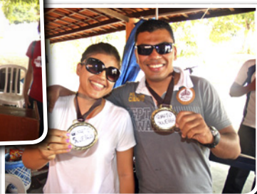
Campeões: Os Mais Sujinhos