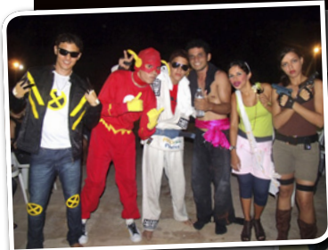
Social: Criatividade e Alegria