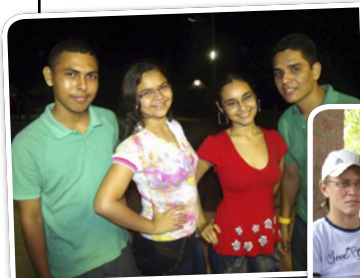
Cong. Araturi: Presente