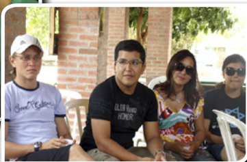
Conselheiros: cooperação e oração