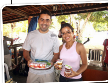
Trofeu: Os Mais Limpinhos