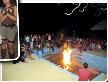
Testemunhos a luz da fogueira