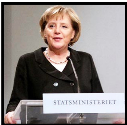
Merkel critica falta de Cristianismo no país

A chanceler da Alemanha, Angela Merkel, recebeu um grande aplauso do Congresso do seu partido, a União Democrata Cristã, ao anunciar que o problema da Alemanha não é um excesso de Islã, mas sim de uma escassez de Cristianismo.