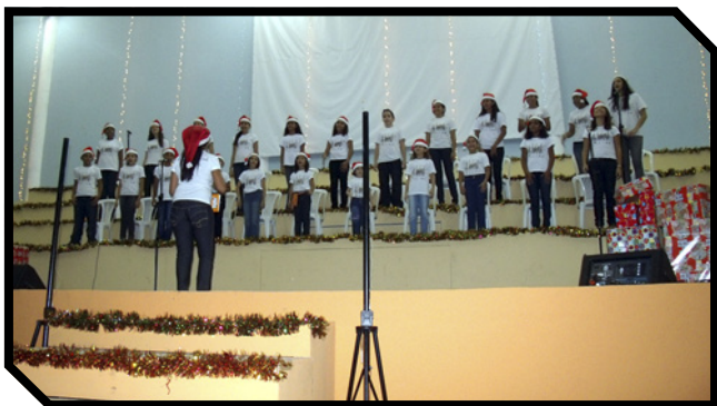
O Coral Infanto-Juvenil Cristo é Vida apresentou a Cantata de Natal na igreja e num colégio