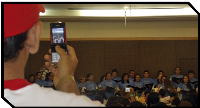
Momento em que um funcionário do hotel registra a apresentação do Coral