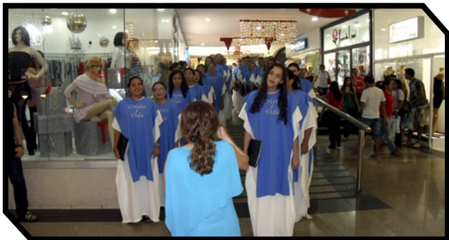
Em shopping, supermercado, hotel e igreja, o Coral Cristo é Vida anunciou as Boas-Novas

O Coral Cristo é Vida e o Coral Infanto-Juvenil resplandeceram a Luz do Mundo no período natalino. Foram várias apresentações, tanto na Igreja como em lugares públicos, criando excelentes oportunidades de distribuir a Palavra de Deus e de testemunhar da salvação em Cristo.