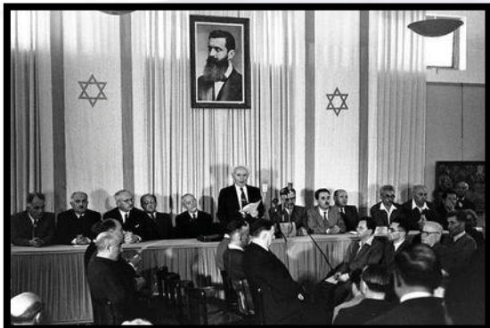
David Ben-Gurion discursa, em 14 de maio de 1948, na Declaração do Estado de Israel com um retrato de Theodor Herzl ao fundo

O feriado ocorre no dia 5 de Iyar, que corresponde a 14 de maio, dia em que David Ben-Gurion declarou o fim do Mandato Britânico sobre a Terra de Canaã e a fundação do moderno Estado de Israel.