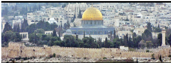
Monte do Templo: Hoje há uma mesquita muçulmana, mas o Templo do Senhor ainda será reconstruído

Em Jerusalém visitaremos o Museu de Israel, a Maquete de Jerusalém antiga e o Santuário do Livro. Visitaremos o Lithostotus – Piso de pedra sobre as ruínas da Fortaleza de Antonia. Ali lembraremos o julgamento de Jesus por Pilatos. Chegando ao Jardim do Túmulo, visitaremos o local do Gólgota e o Túmulo Vazio.