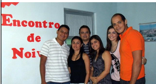
Encontro Pastoral com os Noivos