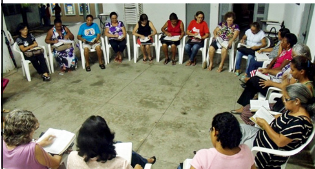
Ministério Dorcas – Edificação e Serviço