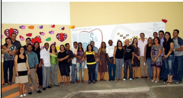
Encontro de Casais – Estudamos o Romantismo no Casamento